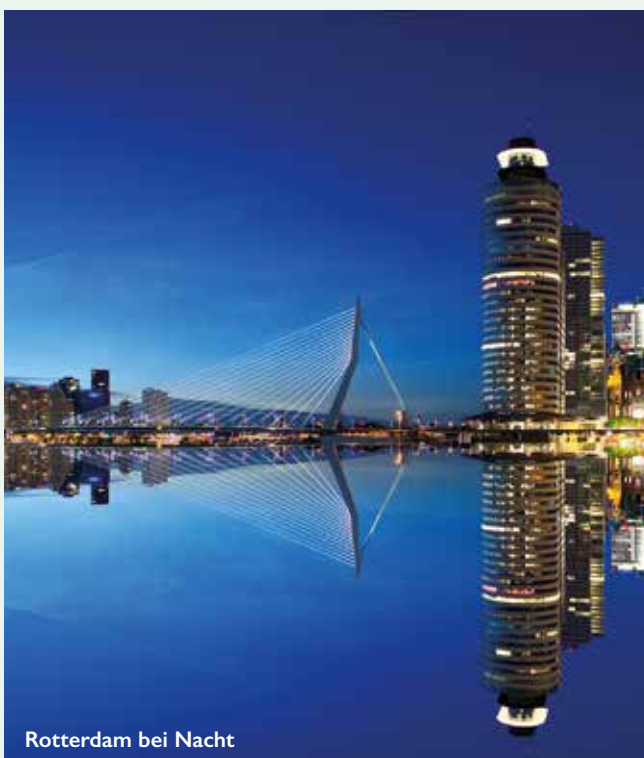
Rotterdam bei Nacht

Pro Kabine kann nur das gleiche Getränkpaket gebucht werden (Ausnahme: Kinder unter 18 Jahren). Die Getränkepakete sind nicht auf andere Personen übertragbar. Die Getränke werden von 08.00 bis 24.00 Uhr angeboten (GP 10 und GP 11). Die Getränke werden nur in Gläsern ausgedient.